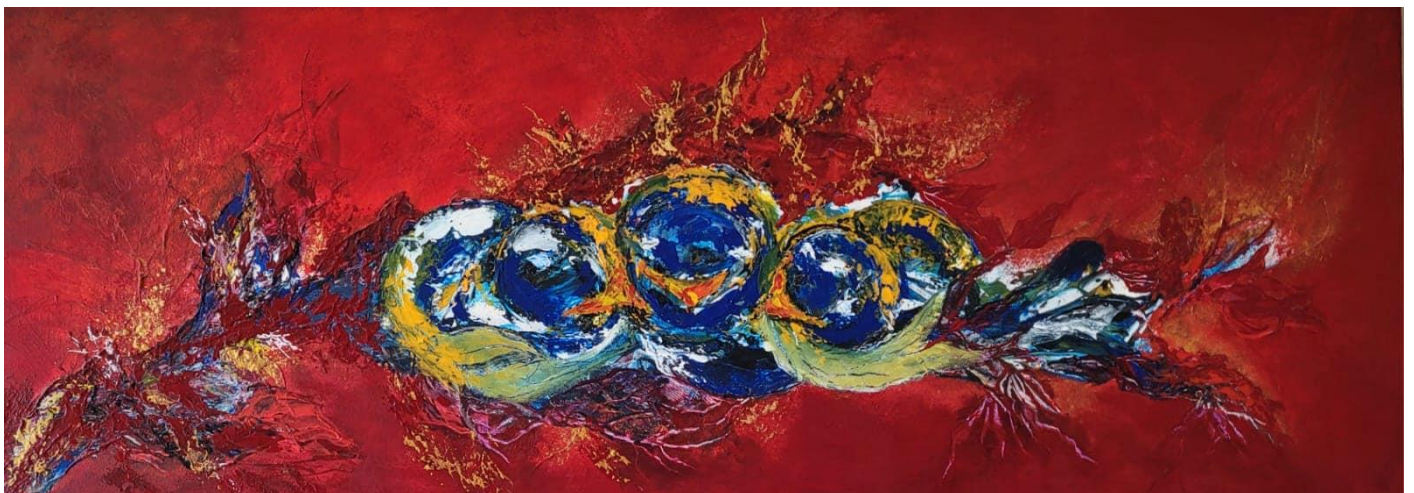
Foto: Schilderij van mevrouw Albers van der Linden, te bewonderen in Liduina

Na de vieringen is er koffiedrinken in de recreatiezaal